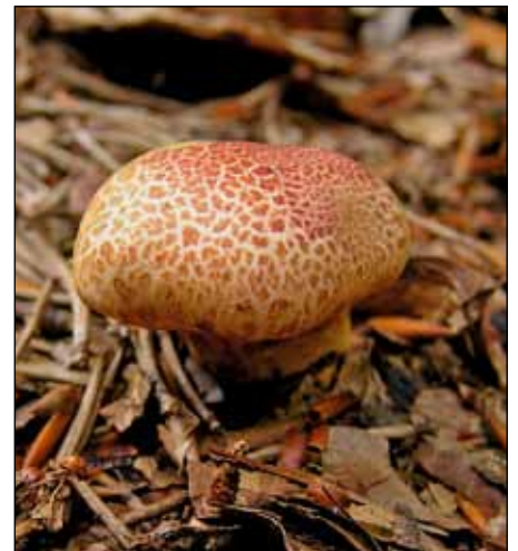
roodschubbig gordijnzwam, Sparrenrijk