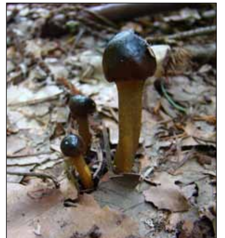
grootsporige truffelknotszwam, Velder