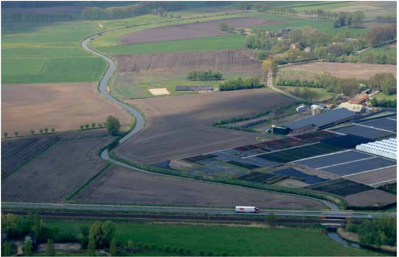
Smalwater-Noord voor (boven) en na de ingreep.